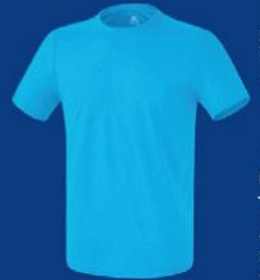
CURACAO Herren S-3XL Damen 34-48