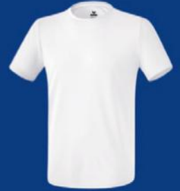
WEISS Herren S-3XL Damen 36-44