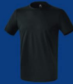
SCHWARZ Herren S-XXL Damen 36-44