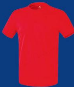
ROT Herren S-3XL Damen 34-48