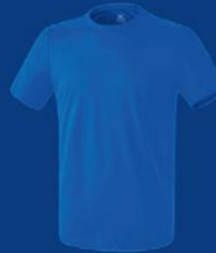
NEW ROYAL Herren S-XL Damen 36-46