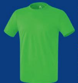
GREEN Herren S-3XL Damen 34-46

Leichtes und schnelltrocknendes Funktionspolyester | 100% Polyester Herren: wie abgebildet | Damen: taillierter Schnitt