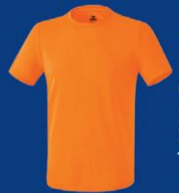
ORANGE Herren S-3XL Damen 34-48