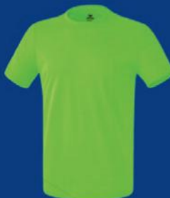
GREEN GECKO Herren S-3XL Damen 36-48